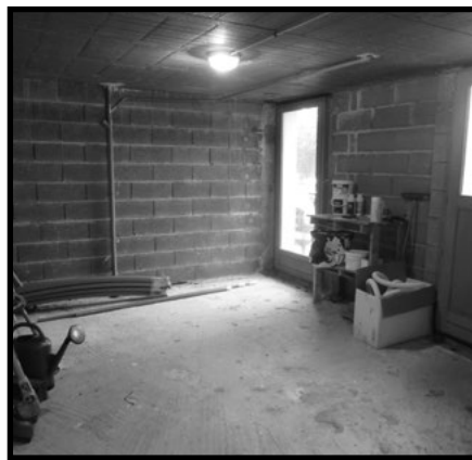
L'existant : parpaings nus, dalle béton et terre battue.