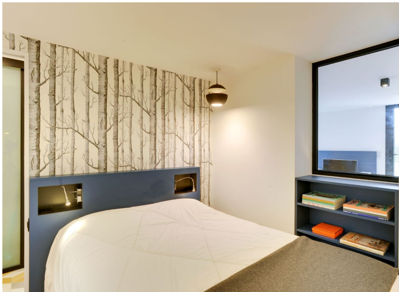
Côté lit , suspension chambre Here Comes the Sun créée en août 1970 par l'architecte toulousain Bertrand Balas et réédité par DCW éditions. Liseuses fournies par Agem placées dans des niches gris anthracite. Papier peint Woods de Cole & Son acheté chez Flanelle Décoration (Toulouse).