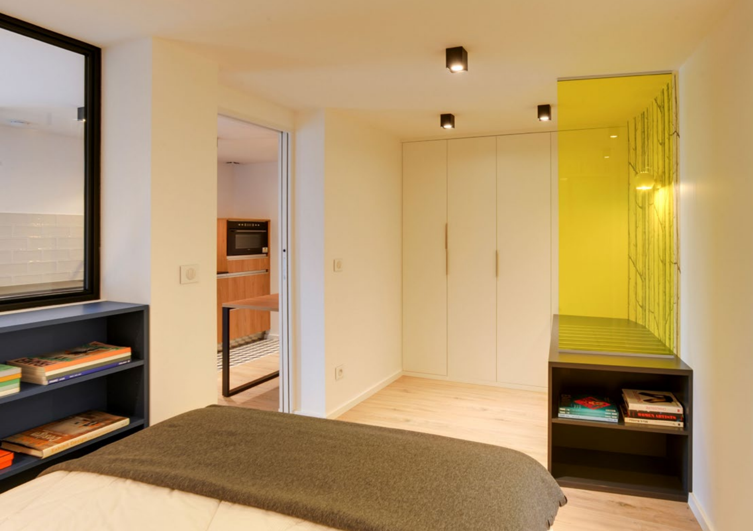
Côté penderie , applique Ball de chez Frandsen, réédition de 1969. Verre de séparation teinté jaune. Dressing et meuble porte-bagages sur-mesure par Agem (Balma).